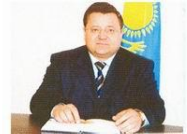
Кулагин С.В., аким области, председатель областной Ассамблеи народов Казахстана