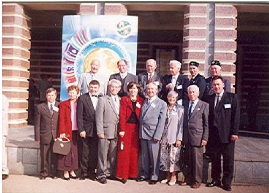
Делегация Казахстана на III. Всемирном конгрессе татар. г.Казань. 2002 г. Август.

Уже через короткое время Центр смог серьезно о себе заявить. На областном радио была создана информационно-музыкальная передача «Якташ» («Земляк») на татарском языке. Открыта воскресная школа для желающих изучать родной язык, культуру и традиции своего народа. Доброй традицией стало ежегодное проведение дней татарской культуры «В созвездии наций», башкирского праздника, посвященного Салавату Юлаеву, поэтических вечеров, посвященных татарскому поэту Габдулле Тукаю, праздников «Заветный бабушкин сундук», чая, гусяного пера, массовых субботников по наведению порядка на захоронении мусульман в Костанайе и других. Поистине визитной карточкой НКЦ «Дуслык» является ежегодное (с 1997 года) проведение с большим размахом народного праздника Сабантуй на центральной площади областного центра с разнообразной концертной программой, народными спортивными играми и забавами. «Дуслык» активно сотрудничает со Школой этнокультурного диалога (СШ № 23 г. Костанай), с Центром национальных культур областной универсальной научной библиотеки им.Толстого, на базе которого ведет большую исследовательскую работу по истории своего народа. Члены правления Центра участники ряда крупных международных форумов татар, республиканских научно-практических конференций, семинаров-практикумов и молодежных слетов.