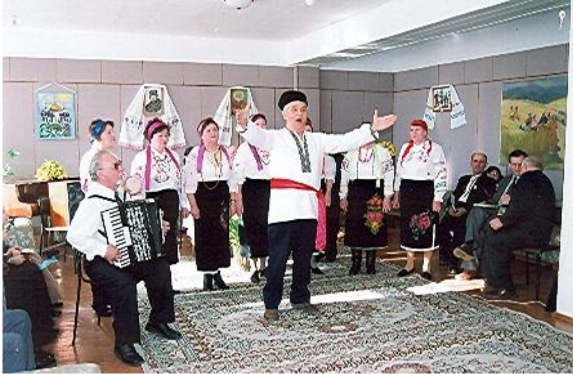
На праздновании 190-летия украинского кобзаря Шевченко Т.Г. в областной универсальной научной библиотеке им.Толстого

Украинская община в своей практической деятельности со дня своего создания ставила целью не только сохранение и развитие языка, культуры традиций украинского народа, но и неуклонное укрепление и развитие контактов и отношений со всеми диаспорами области и Казахстана. И этому главному принципу в своей работе следует неизменно.