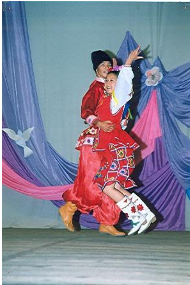
Украинский танец в исполнении танцевальной пары из г. Аркалыка, лауреат областного фестиваля украинского народного творчества.

При содействии общественного фонда «Ардагер» («Ветеран»), созданного при общине, большая благотворительная помощь в стоматологических услугах оказывается ветеранам войны и малоимущим. При общине создана и работает воскресная школа по изучению языка, истории, культуры, традиций и обычаев украинского народа.