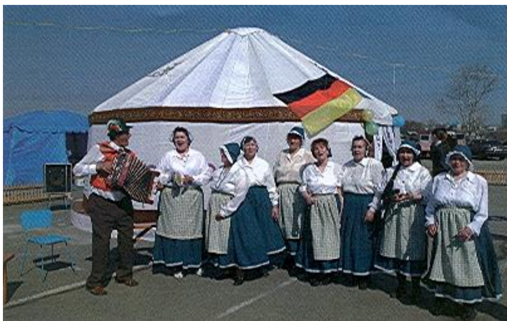
Ансамбль немецкой песни на праздновании Наурыз мейрамы. 2005 г.