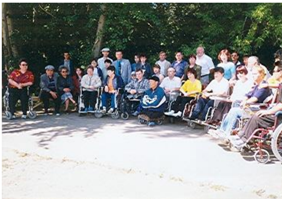
Инвалидные коляски – инвалидам области. Очередной дар НКЦ «Янтарь».

Особый аспект деятельности Центра – работа с молодежью. Центром созданы три дворовых клуба. В период летних каникул для более чем ста детей организуются летние дворовые площадки. При НКЦ «Янтарь» успешно работают молодежные общественные объединения в которых занимается более 300 детей и в рамках которых проводятся всевозможные культурно-массовые и спортивные фестивали и турниры. Масштабная работа Центром, совместно с общественным фондом «Стефан», который наладил связи с общественными организациями многих стран мира, проводится по оказанию адресной благотворительной помощи лечебным учреждениям области, школам-интернатам, детским домам, ветеранам Великой Отечественной войны, малоимущим семьям. Центром оказано содействие в открытии и оснащении необходимым оборудованием реанимационных палат в областной и реанимационной Костанайской городской больницах, также нескольких медицинских палат в г.Рудный, городской больнице Тарановском районе, п. Качар. Инвалидам безвозмездно предоставлено более 200 инвалидных колясок. Многим приютам, детским домам, домам