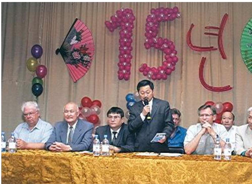
Участники праздничного концерта, посвященного 15-летию областного филиала Ассоциации корейцев Казахстана. г.Костанай, 28 мая, 2005 г.

Замечательный писатель Анатолий Ким утверждал: «Каждому из нас изначально дана свобода самому быть творцом своей жизни. И она будет на вечные времена такой, какую удастся нам сотворить». Корейская диаспора области и её областной филиал многократно и убедительно доказывали, что действительно они сами являются творцами и своей жизни, и судьбы. И пусть так будет всегда.