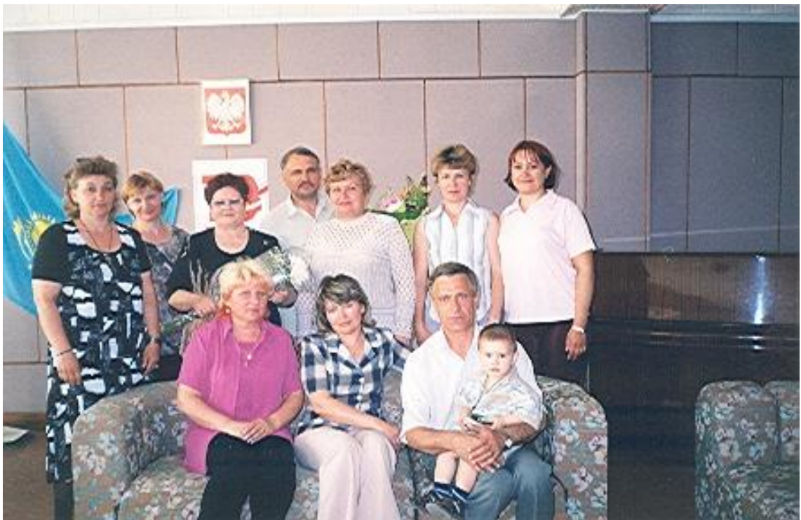
Активисты общества «Надея» в литературной гостиной областной универсальной научной библиотеки им.Толстого.