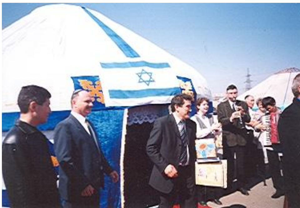
Казахско-еврейская юрта на Наурыз мейрамы.

помощь детям из малоимущих семей и детям из группы риска. По воскресеньям работают женский клуб, литературная и музыкальная гостиные. Организуются праздники книги, проходят беседы о национальных традициях, истории евреев, организуются встречи с соотечественниками, выехавшими на постоянное место жительства в Израиль и Германию. Стало доброй традицией многие мероприятия проводить совместно всеми общественными объединениями евреев области. В их числе День памяти жертв геноцида еврейского народа и таких праздников, как Рош-Ашана, Ханука, Пурим, Песах, фестиваль еврейской книги и других.