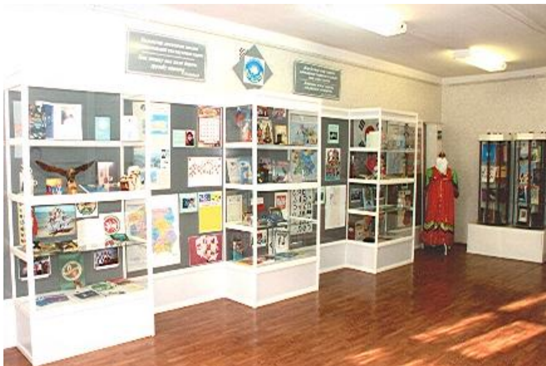
Фрагмент экспозиции о деятельности областных воскресных школ в мемориальном музее И.Алтынсарина

городской средней школе № 23 - Школа этнокультурного диалога, в Костанайском госуниверситете им. А. Байтурсынова – студенческая Ассамблея народов Казахстана. Деятельность областной Ассамблеи широко представлена и на экспозиции «От первого лица...», открытой 29 апреля 2005 года в Центральном государственном музее Республики Казахстан г. Алматы и посвященной 10-летию со дня образования Ассамблеи народов Казахстана.