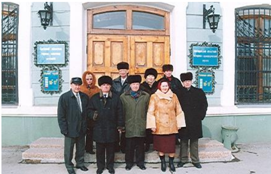
Делегация Курганской области Российской Федерации во время посещения экспозиции областной Ассамблеи народов Казахстана в областном историко-краеведческом музее. г.Костанай, март 2002г.