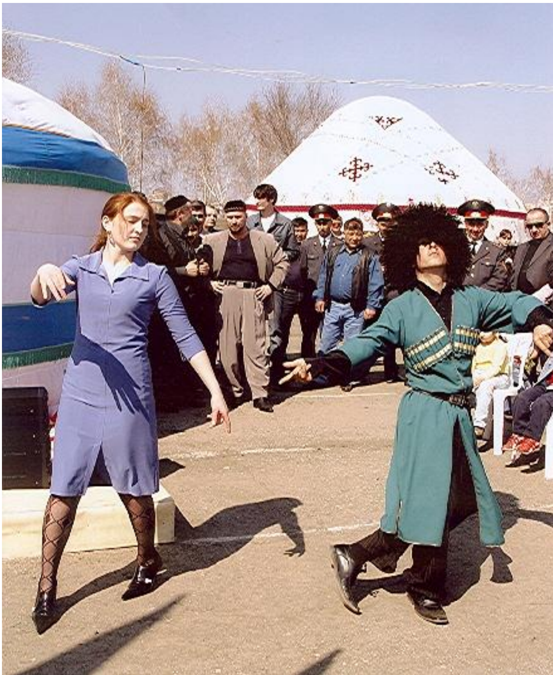
Зажигательный танец. На праздновании Наурыз мейрамы.