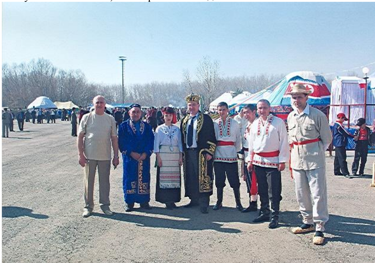
Белорусы-казахи – дружба навек.

Доброй традицией Центра является чествование ветеранов Великой Отечественной войны - освободителей Белоруссии. Около 600 из них удостоены юбилейной медали «60 лет со дня освобождения Белоруссии от фашистских захватчиков». Активное участие члены Центра принимают в общественной и культурной жизни области, в проведении областных фестивалей, творческих конкурсов, народных гуляний. Тесное сотрудничество налажено Центром с Посольством Республики Беларусь в Республике Казахстан, с исторической Родиной.