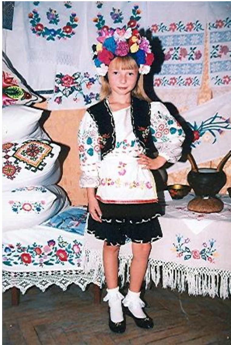
Я - украиночка

Песенное творчество украинского народа ежегодно достойно представлено на международных, областных фестивалях народного творчества, Дружбы народов, «Золотой микрофон» и других.